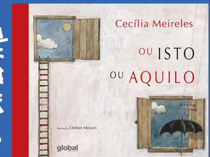
Ou Isto Ou Aquilo Autora: Cecília Meireles Editora: Global