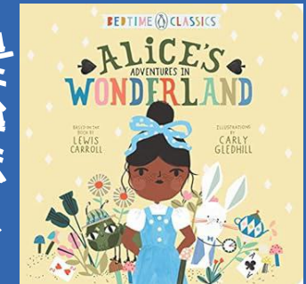
Alice's Wonderland Autor: Lewis Carroll Editora: Viking Books For Young Readers