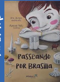
Passeando Por Brasília Autora: Iris Borges Editora: Franco Editora