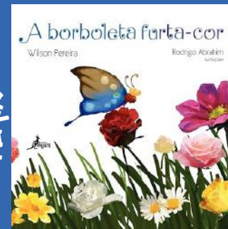
A Borboleta Furta Cor Autor: Wilson Pereira Editora: Canguru