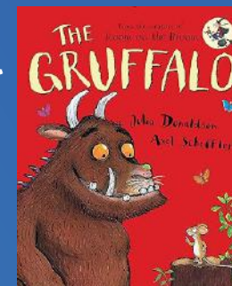
The Gruffalo Autora: Julia Donaldson Editora: Puffin Books