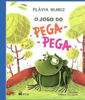
O Jogo Do Pega Pega Autora: Flávia Muniz Editora: FTD