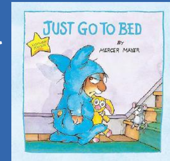
Just Go To Bed (Little Critter) Autor: Mercer Mayer Random House Books For Young Readers