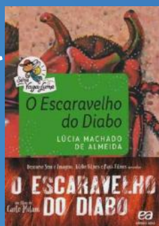
O Escaravelho Do Diabo Autora: Lúcia Machado De Almeida Editora: Ática