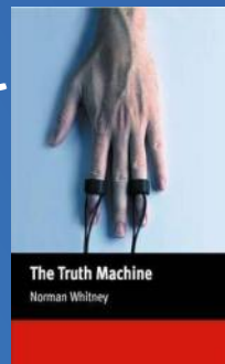
The Truth Machine (Beginner) Autor: Norman Whitney. Editora: Macmillan Readers