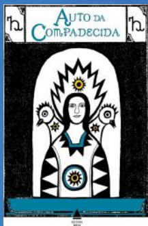
O Auto Da Compadecida Autor: Ariano Suassuna. Editora: Nova Fronteira.