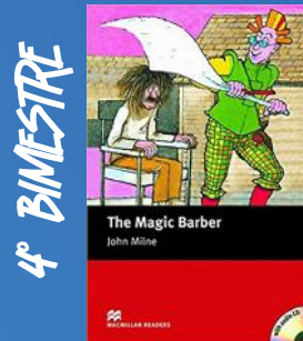
The Magic Barber (Starter) Autor: John Milne Editora: Macmillan Readers