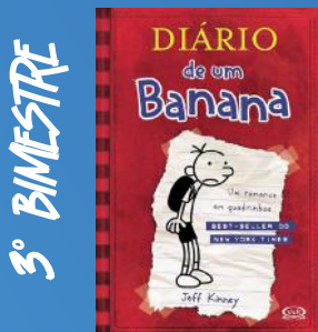
O Diário De Um Banana Autor: Jeff Kinney Editora: V&R EDITORAS