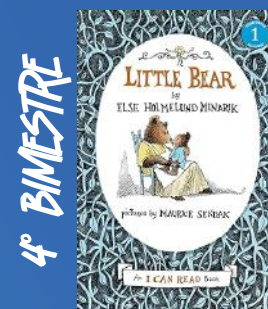
Little Bear Autor: Else Holmelund Minarik Editora: Harpertrophy