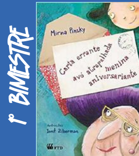
Carta Errante, Avó Atrapalhada, Menina Aniversariante Autora: Mirna Pinsky Editora: FTD