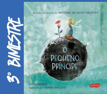
O Pequeno Príncipe Para Crianças Autor: Antoine De Saint Exupéry Edição Atualiza Editora: FTD