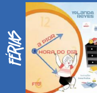
O A Pior Hora Do Dia Autor: Yolanda Reyes Editora: FTD