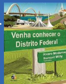
Venha Conhecer O Distrito Federal Autora: Álvaro Modernell Editora: Mais Amigos