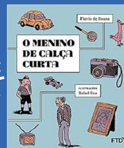
O Menino De Calça Curta Autor: Flávio De Souza Editora: FTD