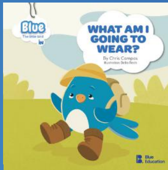
What am I going to wear? Autora: Chris Campos Editora: Blue Education