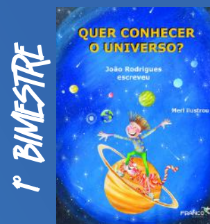
Quer Conhecer O Universo? Autor: João Rodrigues Editora: Franco