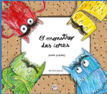
O Monstro Das Cores Autora: Anna Llenas Editora: Franco