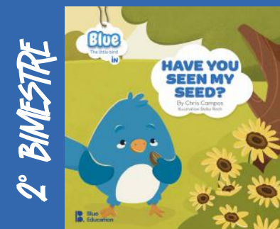
Have You Seen My Seed? Autora: Chris Campos Editora: Blue Education